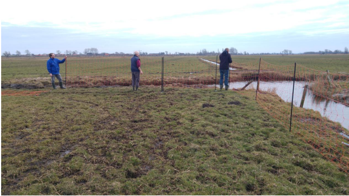
De hekken moeten in elkaar worden gezet, geplaatst en spanningsloos uitproberen.